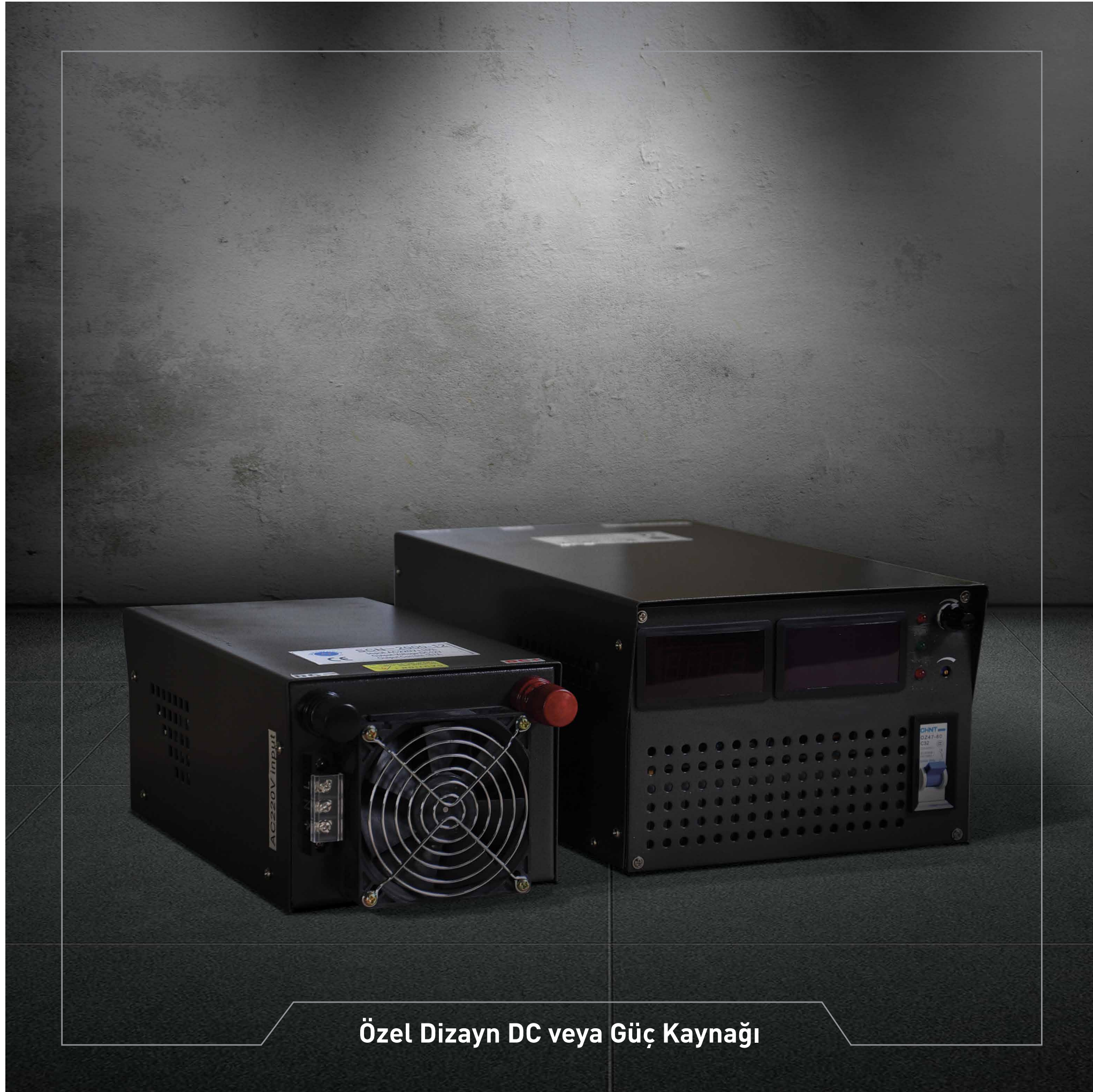
Özel Dizayn DC veya Güç Kaynağı